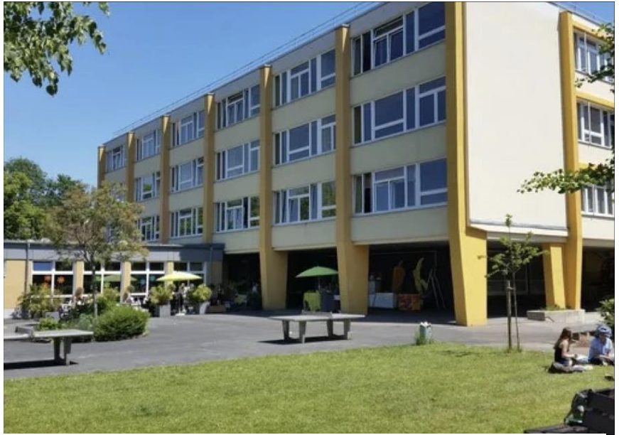
Abbildung 1: Unser Schulgebäude inklusive Schulhof und Mensa