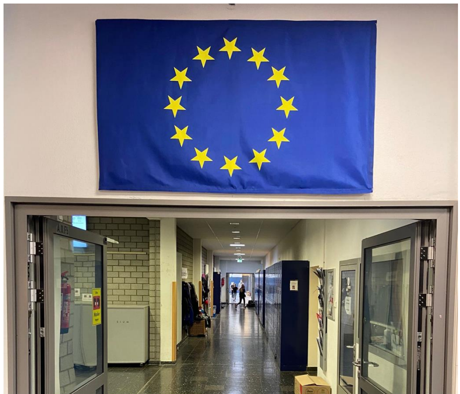
Abbildung 4: Das Erasmus-Gymnasium steht für Europa!

Unsere Schule bietet den Schülerinnen und Schülern in unserer sogenannten „SV“ auch an, sich bei schulinternen Entscheidungen zu beteiligen. Neben der SV gibt es ein Streitschlichter-Team sowie ein Erste-Hilfe-Team.