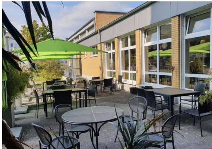
Abbildung 2: Schulmensa (Außenbereich)

Zum Schulgelände gehören zwei Gebäude, die jeweils in A und B unterteilt sind. Außerdem verfügt unsere Schule über eine große und gut ausgestattete Aula mit Bühne, zwei Sporthallen und ein weitläufiges Sportgelände mit